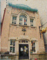
北浜レトロビルディング