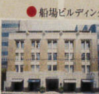
● 船場ビルディング