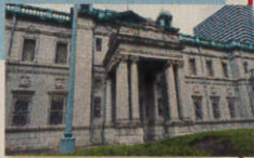
● 日本銀行大阪支店旧館